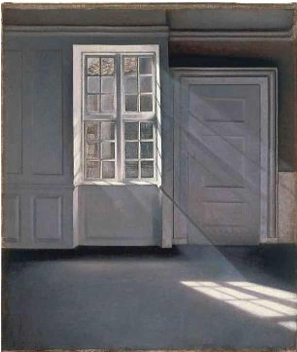
Vilhelm Hammershøi, Sonnenstrahlen oder Sonnenlicht

Gehen Sie die einzelnen Fragen durch. Es gibt keine richtigen und falschen Antworten; es gibt nur die eigene Erfahrung. Wie bei Psalm-Impuls kann auch hier anschließend das Danklied „Nun saget Dank und lobt den Herren“(GL 385 / Kirchengesangbuch 440) gesungen werden.